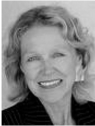
Sylvia Kotting-Uhl, MdB, Umweltpolitische Sprecherin Bundestagsfraktion www.kotting-uhl.de

Es heißt also kämpfen – und zwar nicht nur gegen die Chemiehämmer, sondern auch für Geschlechtergerechtigkeit: Der Mythos, Frauen hätten „natürlicherweise“ ein größeres Interesse an Schutz und Erhalt der Umwelt, wird nämlich in der oben erwähnten WEN-Studie relativiert. „Nicht das Geschlecht selbst, sondern ein ausgeprägtes Bewusstsein für Geschlechtergerechtigkeit erhöht auch den Grad des Umweltbewusstseins – bei Frauen und bei Männern.“