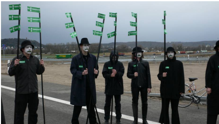
Die Initiative NOrdTANGENTE bei der Verkehrsfreigabe am 5. März 2007

Doch warum eigentlich 2012? Laut Prioritätenliste des Landes ist für den Weiterbau der Nordtangente-Ost Richtung Haid-und-Neu-Straße vor 2025 nicht zu rechnen. Eine