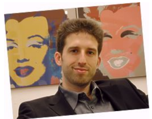
Boris Palmer, Oberbürgermeister Tübingen