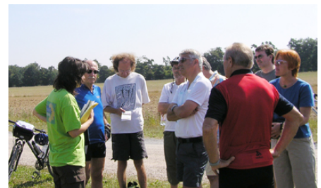
Auch auf der Fahrradtour wurde die Fleischwerkplanung diskutiert.

Und auch in Sachen Kohlekraftwerk war die Landespolitik gefragt: Gisela nahm am 17. Juli an dem Vorort-Termin des Petitionsausschusses in Karlsruhe teil. Sie machte deutlich, dass sie die Sorgen und Bedenken der PetentInnen teilt. In ihrer Kritik am Genehmigungsverfahren ging sie insbesondere auf die Unvollständigkeit der Umweltverträglichkeitsprüfung ein, die sich nur auf den geplanten neuen Block, nicht aber auf die Umweltauswirkungen der Gesamtanlage bezog, sowie auf die „Irrelevanz“-Kriterien des Bundesimmissionsschutzgesetzes, die trotz hoher Vorbelastung zur Genehmigungsfähigkeit der Anlage führten.