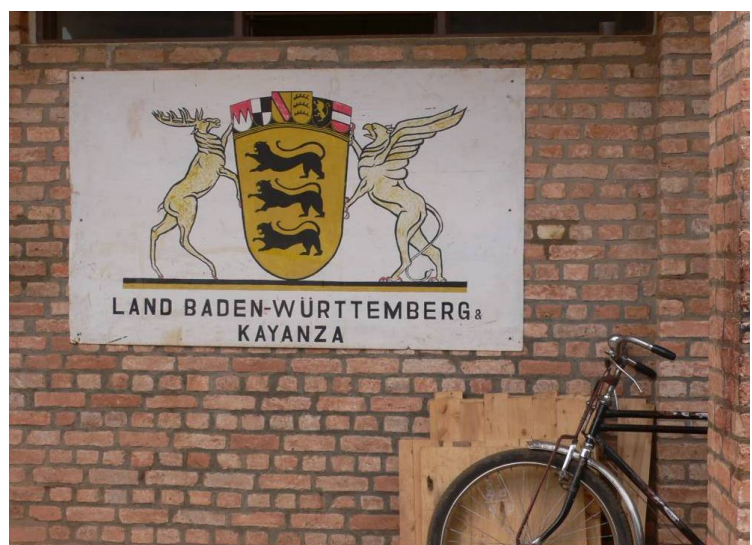
Landtagswappen beim Handwerkprojekt in Kayanza, Burundi

www.gisela-splett.de/graphics/Reisebericht.pdf