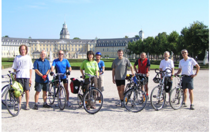
Start am 1. Tag vor dem Karlsruher Schloss

Thematische Schwerpunkte waren Umwelt- und Energiepolitik. Bei manchen der angefahrenen Stationen wie dem Standort des geplanten Edeka-Fleischwerks, der Baustelle des neuen Kohlekraftwerks am Rheinhafen, geplanten Gewerbegebietsausweisungen bei Bühl und einem Straßenbauprojekt bei Stutensee standen die Probleme im Vordergrund. Andere Stationen stellten Positivbeispiele dar, so z.B. das geplante Bürgerwasserkraftwerk in Gernsbach, das Biomassekraftwerk in Malsch ( www.biomassekraftwerk-malsch.de ) und das energetisch sa-