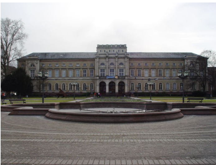
Museum für Naturkunde

www.gruene-karlsruhe.de/fileadmin/gruene-karlsruhe/mdl/PM_Erweiterung_BLB_06.08.08.pdf