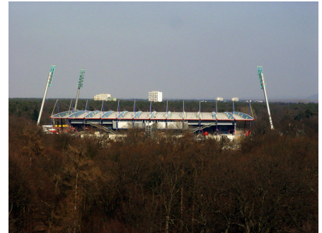
Karlsruher Wildparkstadion.

www.gisela-splett.de/Presse-Wild-park.htm