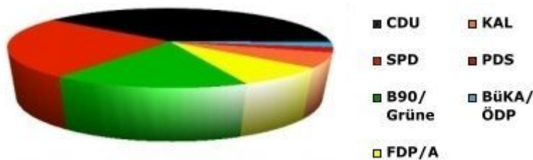
Ergebnisse der letzten beiden Gemeinderatswahlen in Karlsruhe. Und 2009?