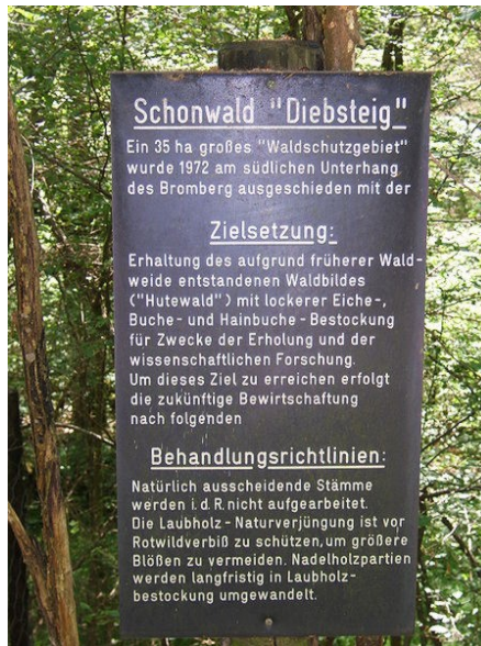
Beispiel: Schonwald "Diebsteig"

sonders wertvolle Bäume in Wald und Offenland sowie im besiedelten Bereich zu erhalten und so gut wie möglich zu schützen.