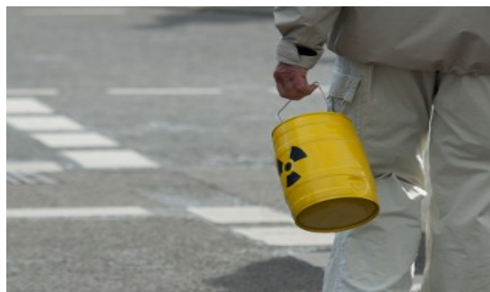
Atomausstieg in die Hand nehmen